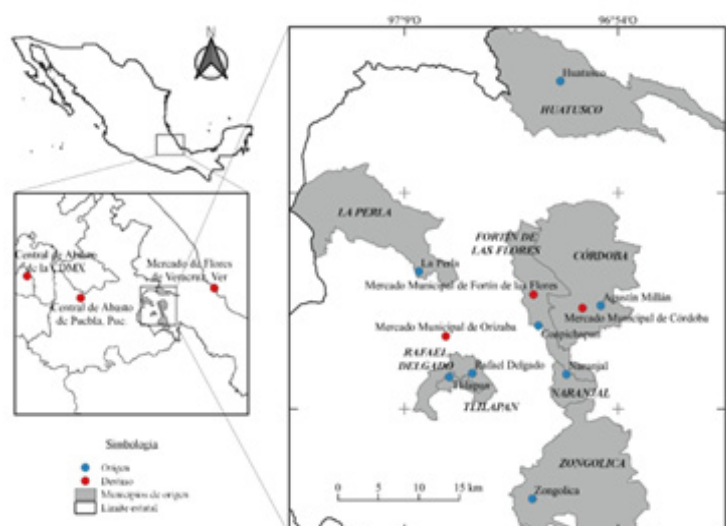
Mapa 1. Influencia territorial de las estrategias de los actores sociales involucrados en la mercantilización de heliconias

de estos y una cadena de negociaciones que impacta en diferentes territorios. En el Mapa 1 se muestra cómo las actividades socioproductivas y comerciales de heliconias en la Comunidad de Coapichapan, Fortín de las flores, Veracruz, tienen influencia en el mismo estado de Veracruz, la Ciudad de México y el estado de Puebla. Por lo tanto, se devela que la actividad local tiene un efecto regional y nacional. No discriminando que existiera un efecto internacional.