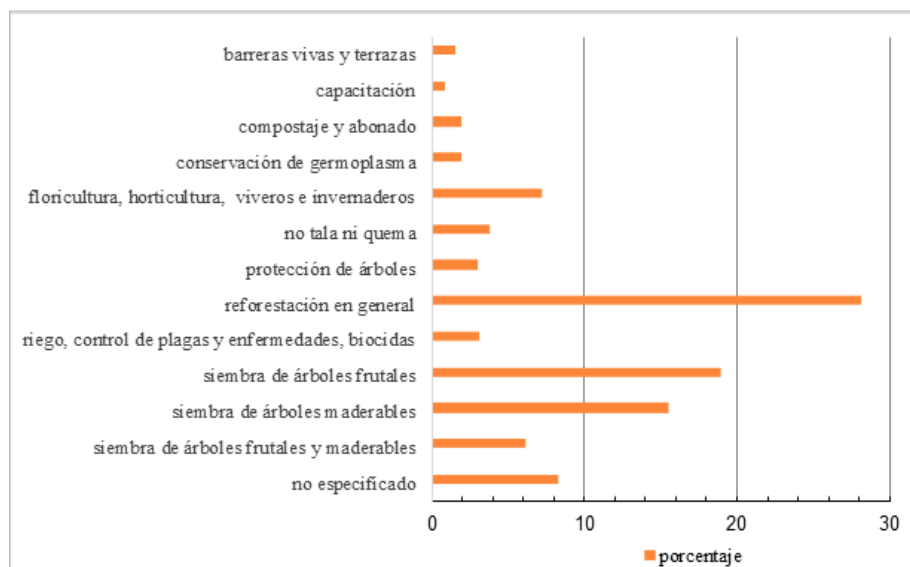
Figura 3. Acciones para la conservación de plantas entre productores de maíz en ejidos de diferentes regiones de Chiapas